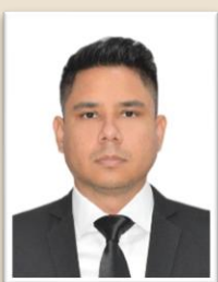
Por : Q.: H.: Gustavo Gallessi