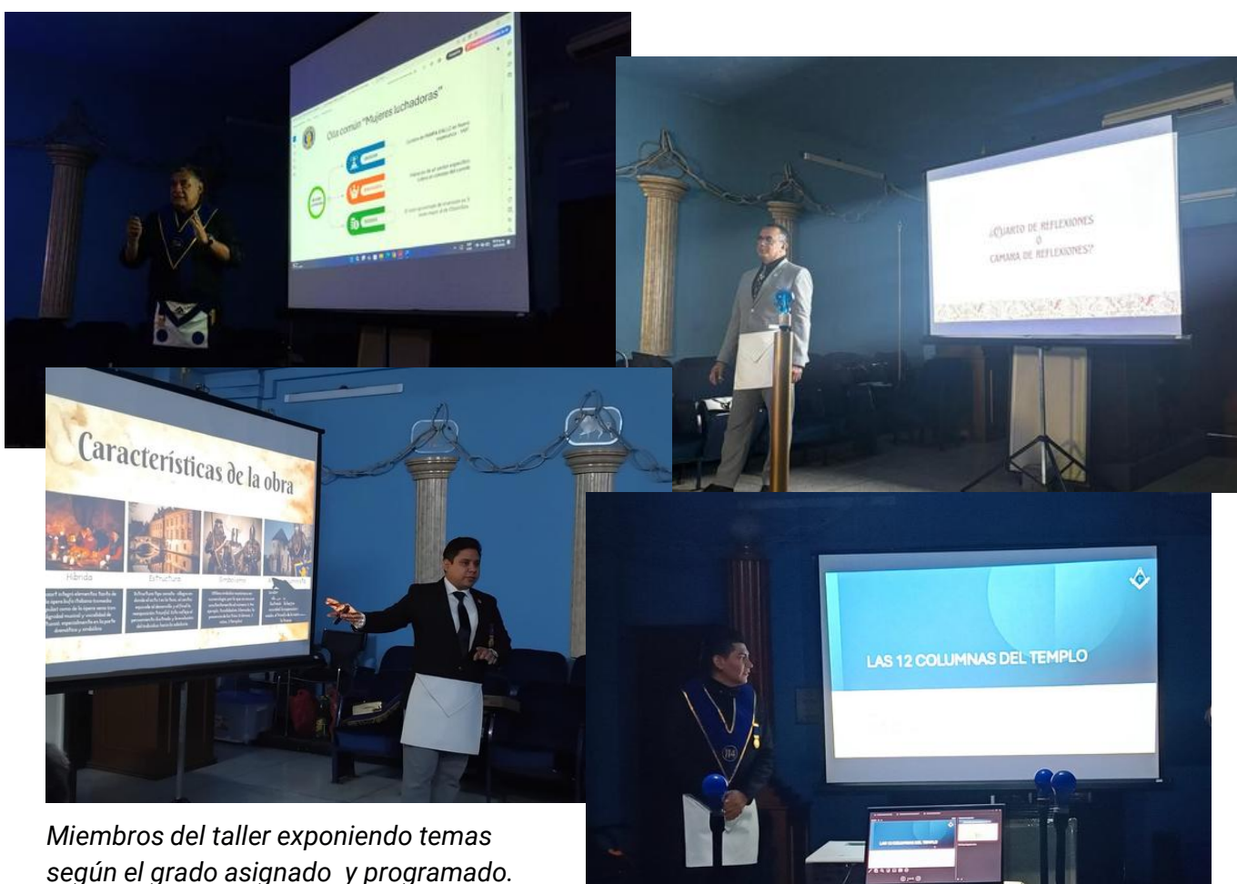
Miembros del taller exponiendo temas según el grado asignado y programado.

Por último, el resultado de este esfuerzo conjunto dará lugar a una valiosa fuente de información masónica, tanto para quienes contribuyen a su elaboración, como para quienes se acercan a su lectura. El espíritu que deseamos fomentar en nuestros Hermanos es el de la mejora continua, mediante el aprovechamiento de todos los medios disponibles, ya sea a través de la lectura tradicional o del acceso a la vasta información disponible en la red. Confiamos en que esta publicación cumpla con las expectativas de nuestros lectores. Asimismo, los invitamos a visitarnos en nuestra página web: WWW.GG114.PE .