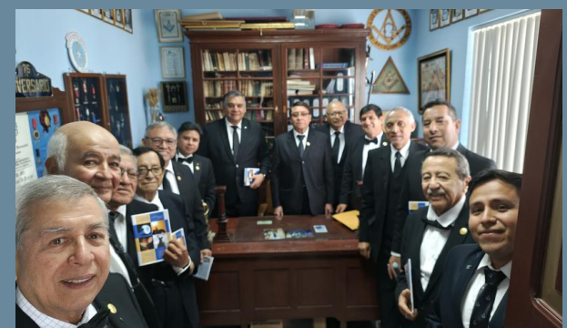
01:00PM Visita a la secretaría y biblioteca de la loggia anfitriona.