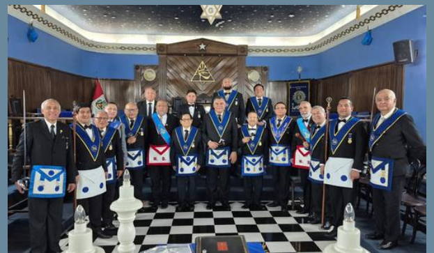
12:00PM Foto grupal con nuestros hermanos anfitriones.