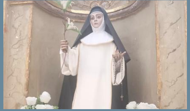
10:30AM Otros hermanos visitan el convento de Santa Catalina