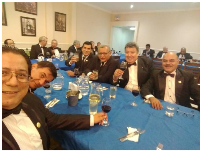
HH.: del taller brindando por el éxito de nuestra nueva logia