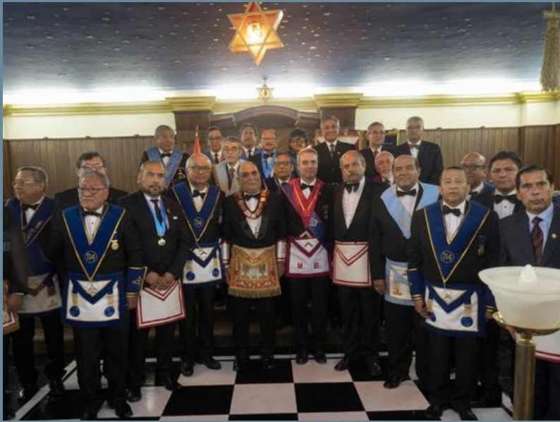
Foto de los asistentes a la Ten. de inst. del C. de DD. y OO. 2019