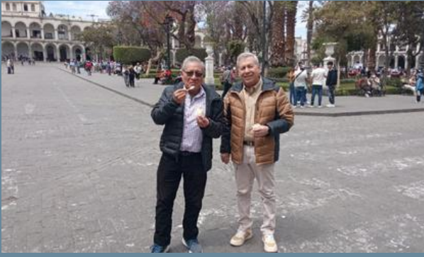
10:00AM Ultimo recorrido por las calles y plazas de Arequipa.