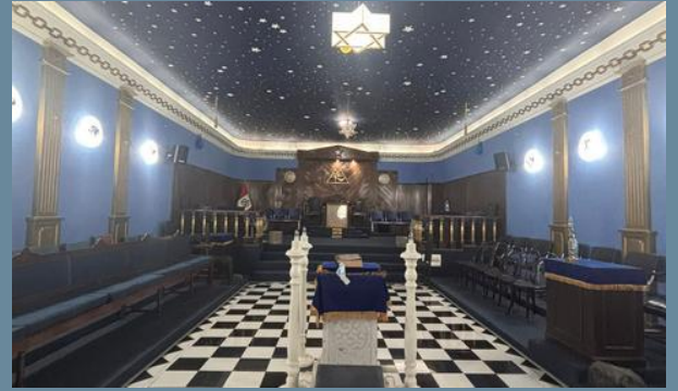
09:30AM Impresionante vista del templo de rito York de la loggia Arequipeña.