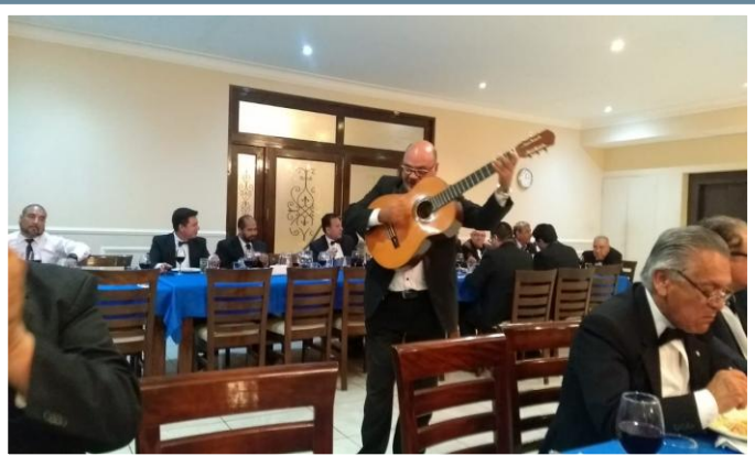
Q.:H.: Miguel Perea artista y cantante de música criolla en repertorio