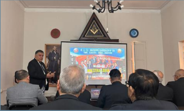
09:10AM Presentación resumen de los objetivos logrados como loggia desde el 2019 - 2025. y la proyección para los próximos años.