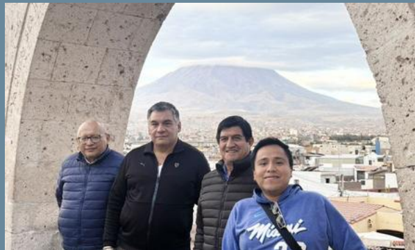
06:00PM Despedida de Arequipa con imagen del misti al fondo en los Arcos de Yanahuara.