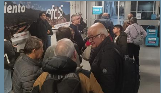
09:30PM En el aeropuerto de Arequipa a punto de subir al avión que nos trae de regreso a Nuestro valle de Lima.