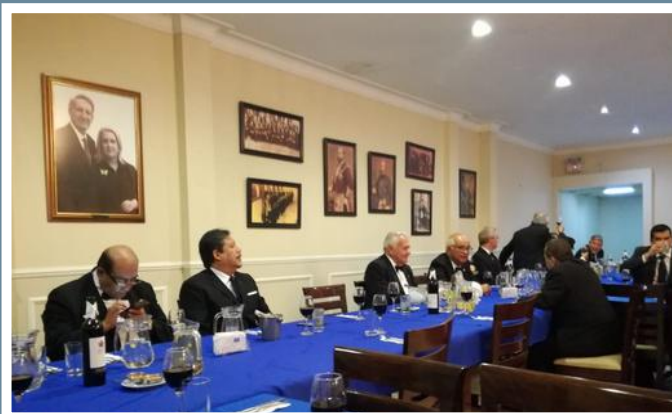
HH.: invitados disfrutando del repertorio musical