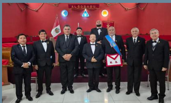
12:30AM Recorrido por el edificio y visita al templo del REAA.